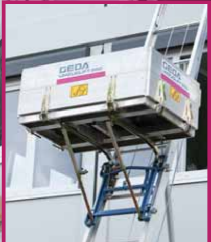
S fiksno ploščadjo