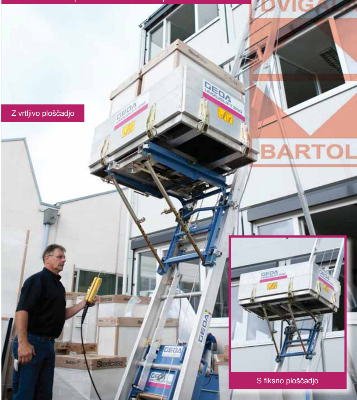
Z vrtljivo ploščadjo